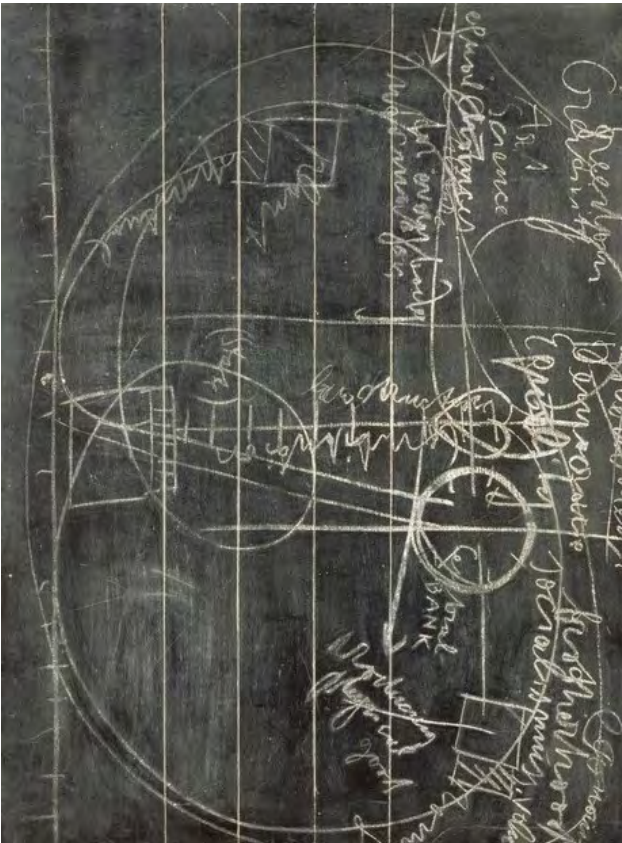
Joseph Beuys Las pizarras http://analogue-underground.tumblr.com/post/124064995223/joseph-beuys-the-blackboards

Una descripción de la investigación artística desde su interior como un nuevo campo de investigación y, como un paradigma en ascenso necesitaría de la pormenorización de los tipos de objetos o temas a los que la investigación está dirigida, de las clases de preguntas formuladas, así como de los tipos de métodos aplicados, y los tipos de conocimiento que ésta genera. Para tal efecto, he decidido describir tal paradigma desde afuera, empleando la palabra “para-