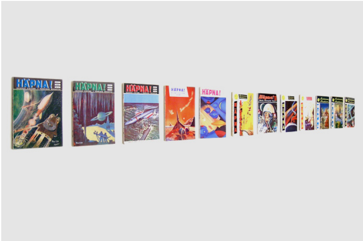
HÄPNA! - De Svenska Rekordåren, 2009

one collected magazine from each year 1954 - 1966