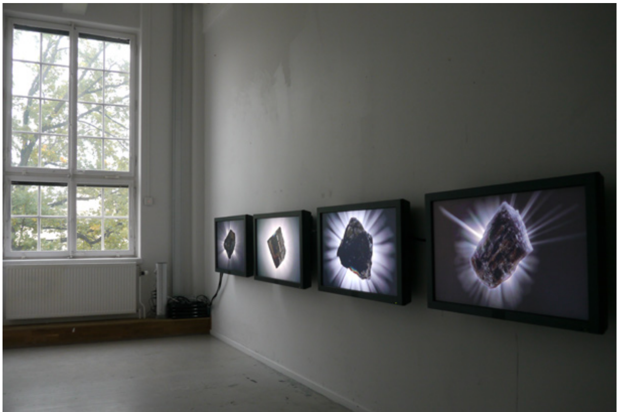
Boulder eclips. (Tantalum, Beryll, Petalit and Columbit), 2010

Inom science fiction genren används ofta vetenskaplig retorik för att få oss att känna att dess utsagor är trovärdiga nog, sannolika, möjliga. Teknologin är dess främsta medium, maskiner som utvidgar mänskliga ingripanden. Jag har alltid varit intresserad av hur min relation till omgivningen formas. I min konst är teknologin avgörande i hur jag förstår och skildrar världen. I verket Boulder Eclips undersökte jag de mineraler som möjliggör den teknologi jag använder. I naturvetenskapliga museets samlingar hittade jag alla de mineraler som behövdes i processen där jag fotade, animerade, printade och projicerade dem. Verket skildrar de mineraler som samtidigt utför verket och som samtidigt omvälver jordskorpans sammansättningar i globala, vådliga utvinningar.