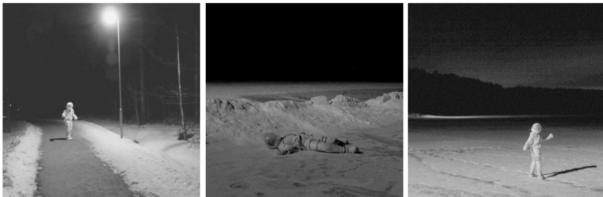
Colonizing futures, Medium-format, black and white film, 2010

Maktaspekten blir också synlig när man tittar på sambandet som finns mellan ekonomisk högkonjunktur och produktionen av sci-fi visioner. Något jag vill peka på i projektet "Häpna! de svenska rekordåren" där de få åren Sverige haft en utgivning av sci-fi tidskrift sammanfaller med de år under 50 & 60-talet som räknas till Sveriges intensivaste högkonjunktur.